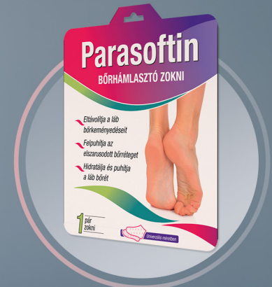
PARASOFTIN Bőrhámlasztó zokni