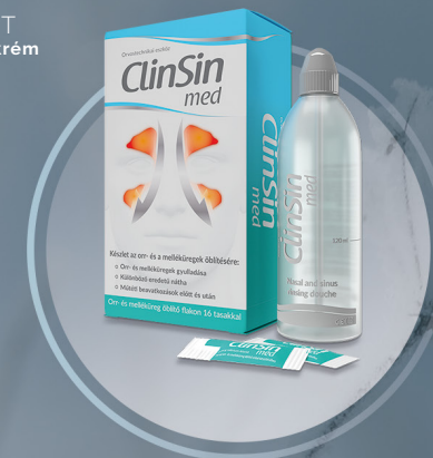
CLINSIN MED Készlet az orr- és melléküregek öblítésére**

* Vény nélkül kapható, ibuprofén tartalmú gyógyszer.