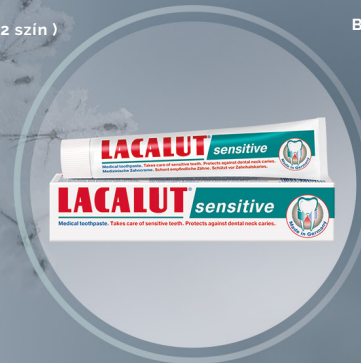
LACALUT sensitive fogkrém