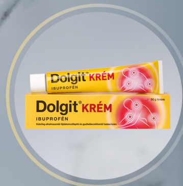
DOLGIT Dolgit krém*