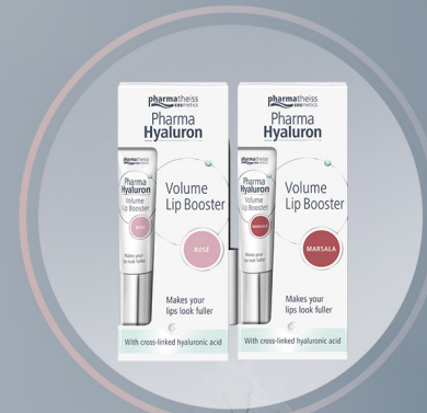
PHARMATHEISS Pharma Hyaluron Volumennövelő ajakápoló (2 szín)

Attól, hogy nincs szem előtt, még télen is fontos talpunk ápolása, hiszen a bőrkeményedések és a repedezések akár komoly fájdalmat is okozhatnak. Próbáld ki a Parasoftin Bőrhámlasztó zoknit , ami innovatív megoldás a talp bőrének intenzív, és kényelmes ápolására. Már egyszeri használat után is hidratált, és bársonyosan puha lesz a talpad. Vedd be ezeket az apró trükköket, és mosolyogj télen is!